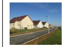
1-Voie primaire Revêtement de sol enrobé + bande stabilisée Circulations mixte véhicules / piétons