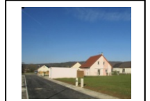
2-Voie secondaire Espace semi-public structuré par les garages en limite Revêtement de sol enrobé. Circulations mixte véhicules