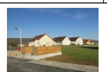
4-Espace poubelle L'espaces poubelles collectif situé en tête de voie sec participe à l'unité bâtie du quartier