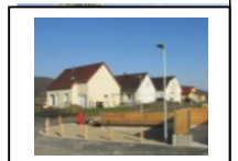
3-Aire de convivialité Espace public en stabilisé