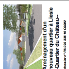
Aménagement d'un nouveau quartier à Liesle -Quartier du Château-