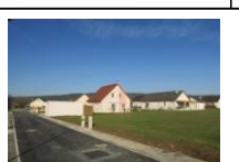
5-Garage et entrée/bâtiment Ouvert sur la voie secondaire marque la limite de la publie / privé en reconstituant le front de rue, et participe bâtie du quartier.