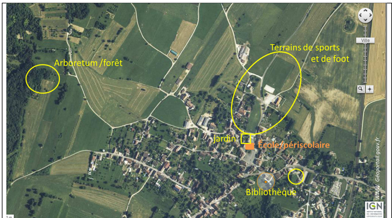
Schéma 2 : Plan de situation géographique