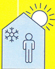
RESTEZ AU FRAIS