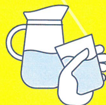
BUVEZ DE L'EAU